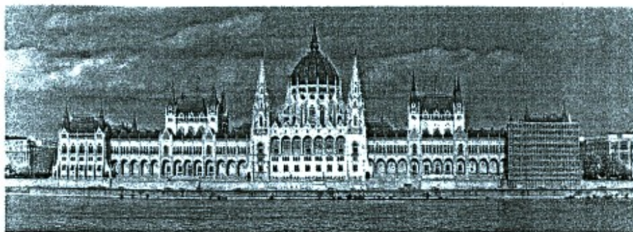
Budapeszt - Parlament

Cena nie zawiera biletów wstępu do zwiedzanych obiektów: ok. 40 Euro oraz do Musikverein: (Bilety w cenie 36 Euro). Obiady w Czechach 4-go dnia ok. 250 Koron